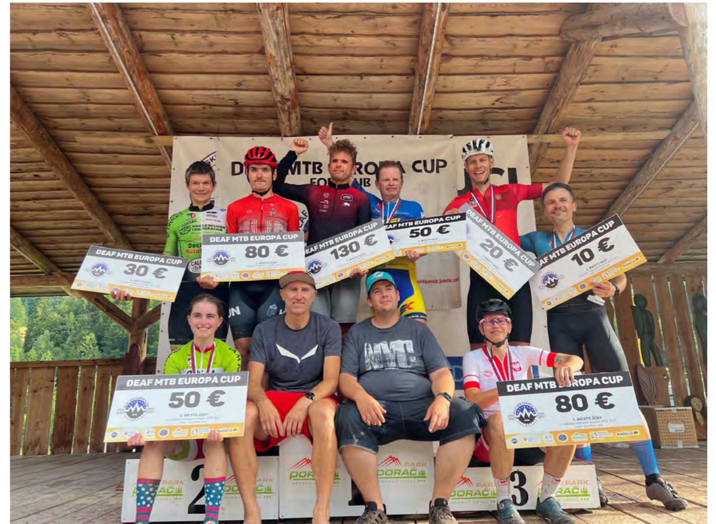
DEAF MTB EUROPA CUP, Porač, Slovensko.