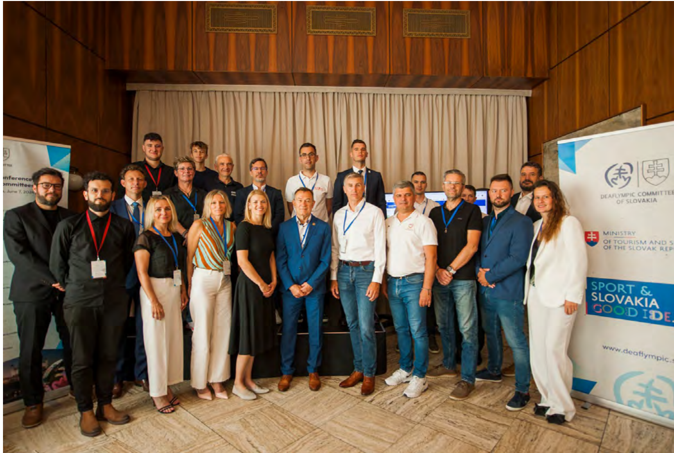
Medzinárodná konferencia deaflympijských výborov, Hotel Devín, Bratislava.