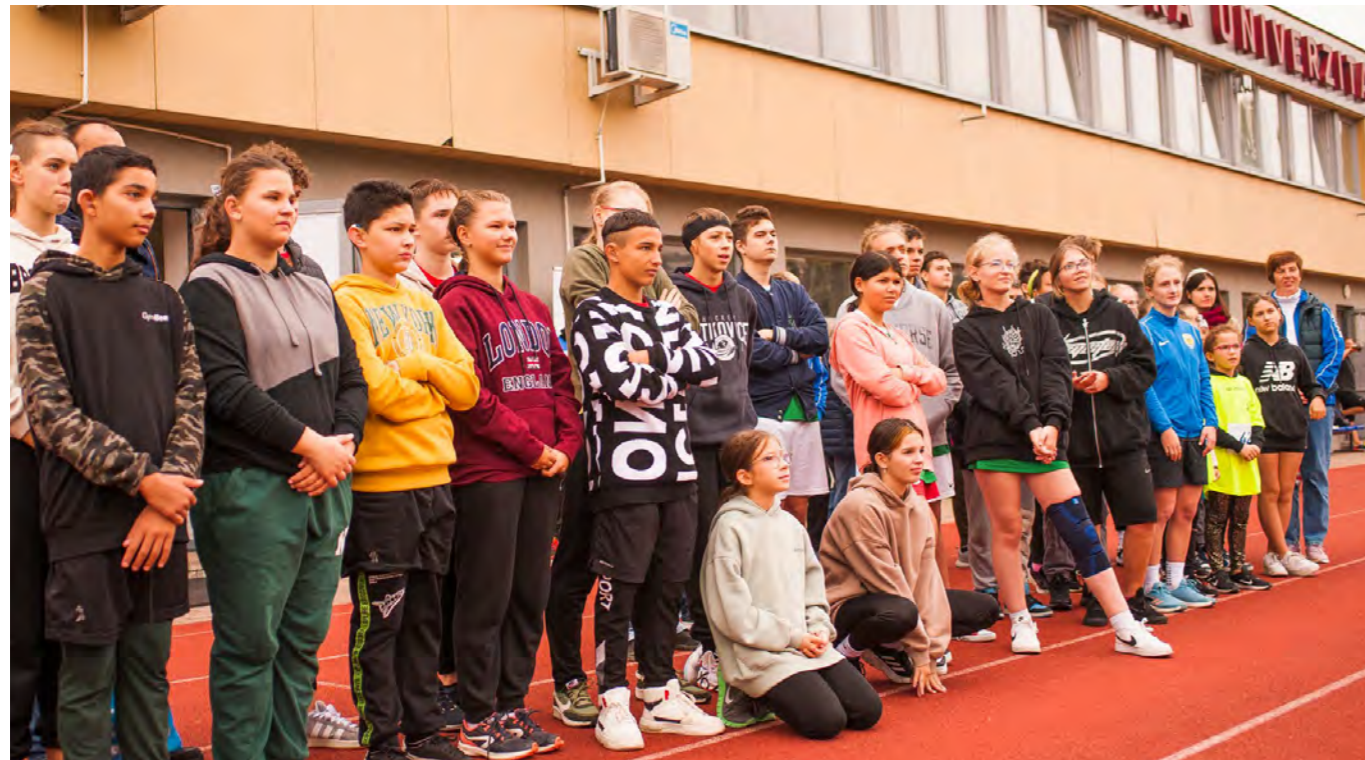
DEAFLYMPIJSKÉ DNI 2024.

Majstrovská súťaž celoslovenského charakteru organizovaná DVS pre nepočujúce deti a mládež zo špeciálnych ZŠ a SŠ z celého Slovenska (viac ako 80 účastníkov) v atletike a stolnom tenise. Toto podujatie zrealizovalo DVS s finančnou podporou Bratislavského samosprávneho kraja s celkovou výškou dotácie 2500 eur.