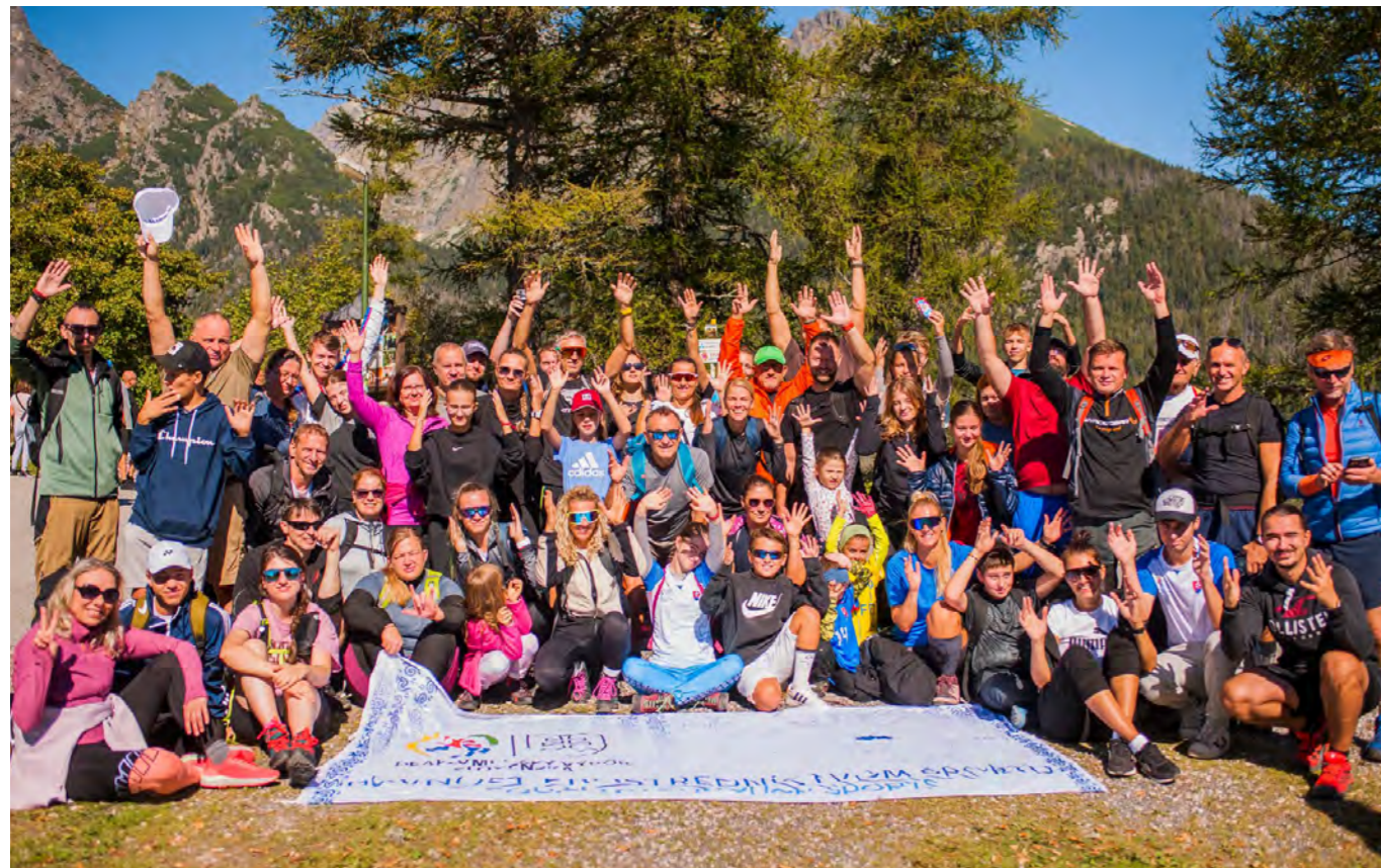
Spoločný výstup k Vodopádom Studeného Potoka, Deaf Tatry 2024.