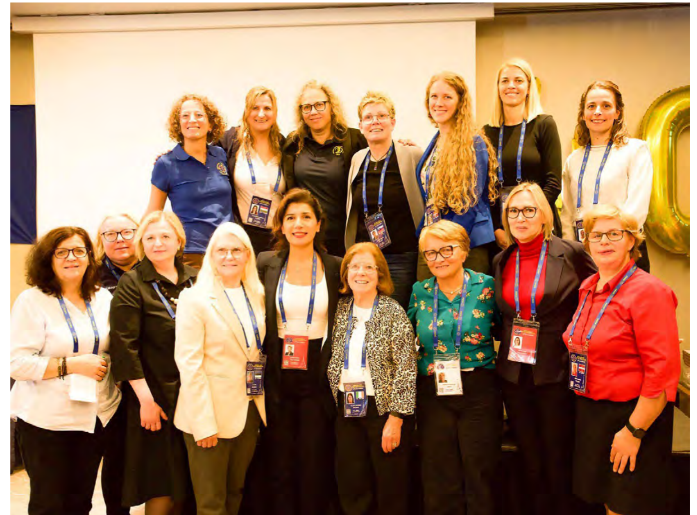
22. kongres EDSO, Paríž 2024.