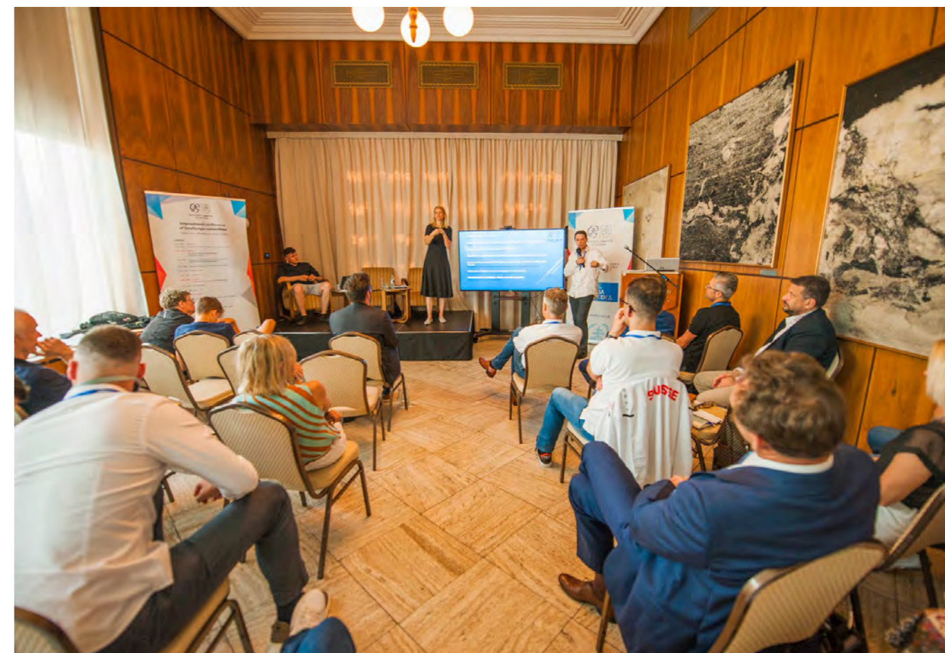
Medzinárodná konferencia deaflympijských výborov, Hotel Devín, Bratislava.