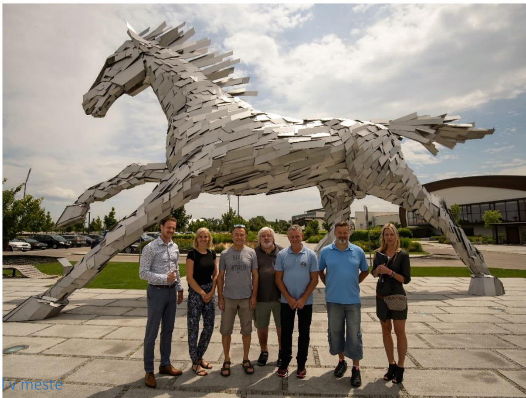
Futbal v meste

usporiadanie takéhoto nevšedného podujatia. Žiaľ, realita (koronavírusová pandémia) nám dobrý zámer uskutočniť toto reprezentatívne podujatie znemožnila a Výkonný výbor sa pre pretrvávajúce a časovo neobmedzené vládne obmedzenia rozhodol organizácie tohto podujatia definitívne vzdať dňa 6. júna 2020 (PR2/2020).